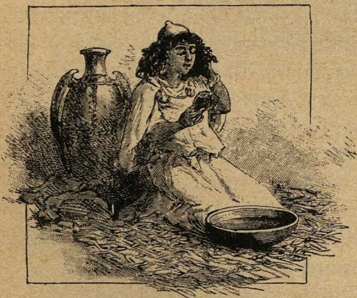
Вода, налитая въ чашку, замѣняла ей зеркало.